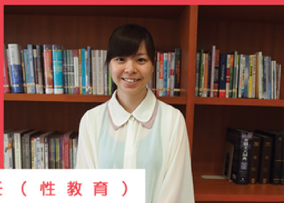
文麗兒小姐 — 項目主任 (性教育)